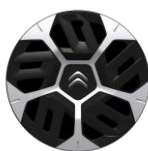
18-Zoll-Stahlfelgen mit Radzierkappen "Aerotech"