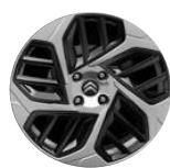
18-Zoll-Leichtmetallfelgen "Aeroblade" Anthra Grau