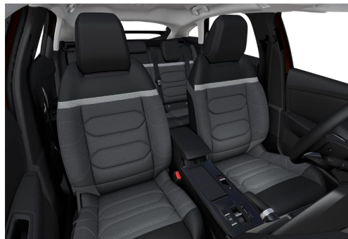
AMBIENTE URBAN GREY