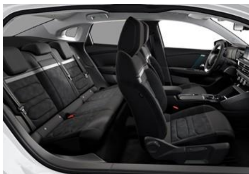
Ambiente Alcantara GREY & Kunstleder BLACK