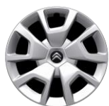
16-Zoll-Stahlfelgen mit Radzierkappen "Spring"