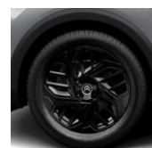
18-Zoll-Leichtmetallfelgen „AEROBLADE“ in Schwarz