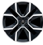
18-Zoll-Leichtmetallfelgen "Crosslight" glanzgedreht