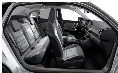
Ambiente Alcantara & Kunstleder GREY