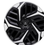
18-Zoll-Leichtmetallfelgen „AEROBLADE“ glanzgedreht