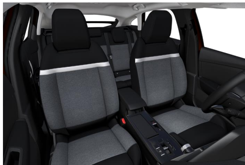
SERIENMÄSSIG STOFF "MEANWHILE"