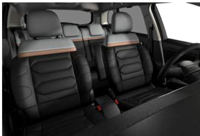
AMBIENTE METROPOLITAN GRAPHITE (OPTIONAL)