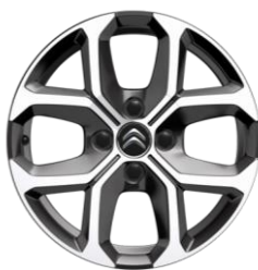
16-Zoll-Leichtmetallfelgen X-CROSS glänzend