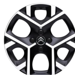
17-Zoll-Leichtmetallfelgen ORIGAMI glänzend