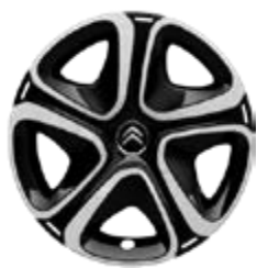
16-Zoll-Radzierblenden STEEL & STYLE