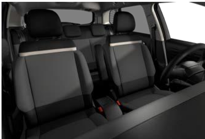
STOFF "MICA" GREY (SERIE)